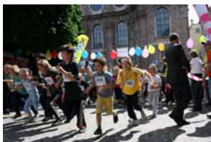
Laufwunder in Innsbruck

Dass Kinder nichts von der Suchtkrankheit ihrer Eltern mitbekommen, ist ein weitverbreiteter Irrglaube. Wie man mit diesem gesellschaftlichen Problem umgeht, und was man dagegen präventiv machen kann, war Thema bei der von der Caritas organisierten Fachtagung "Zukunft. Von Anfang an - Gemeinsam für Kinder von sucht- und psychisch erkrankten Eltern". Das Interesse an diesem Thema war groß - 137 KongressbesucherInnen aus den unterschiedlichsten Bereichen, von der Suchtberatung über Therapieeinrichtungen bis hin zu Schulen, Tagesmüttern und Kliniken, nahmen daran teil.