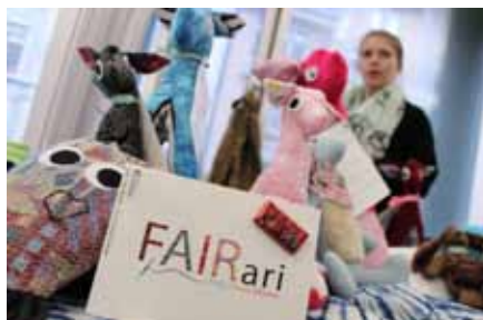
Auf Kuschelkurs mit der Caritas

Bis zuletzt zeigte sich Altbischof Reinhold Stecher als begeisterter Künstler und engagierte sich mit aller Kraft für benachteiligte Menschen. Ein großes Anliegen war ihm die Situation der Menschen im trockenen Westsahel – einer Gegend, wo Wasser keine Selbstverständlichkeit ist. Für sie initiierte er die Aktion „Wasser zum Leben“, bei der er seine Bilder für Caritas-Wasserprojekte in Mali versteigerte. Insgesamt sechs Mal fand die Aktion, die gemeinsam mit der Hypo Tirol organisiert wurde, statt. Zuletzt im November 2012 – es wurden 30 Bilder um 135.700 Euro versteigert. Caritas ist dankbar und sagt Vergelt's Gott.