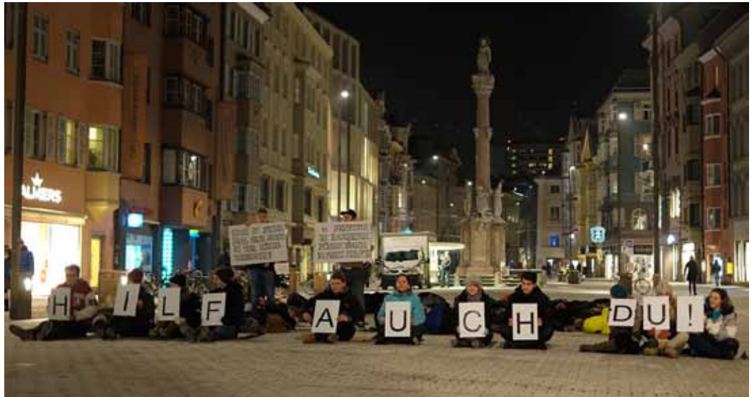
Smartmob zum Thema Obdachlosigkeit: StudentInnen der FH Kufstein organisierten mit der youngCaritas eine Straßenaktion zur Bewusstseinsbildung.