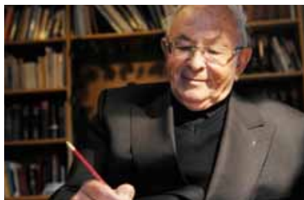
Altbischof Stechers Vermächtnis